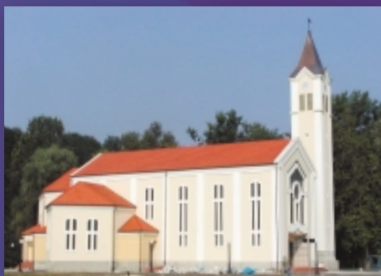
› Sv. Ivan Nepomuk, Glina