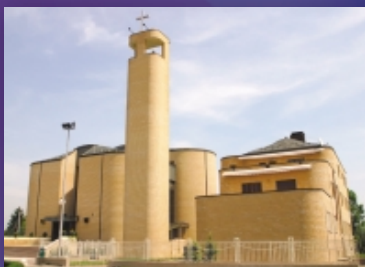
› Sv. Pavao, Zagreb-Retkovec