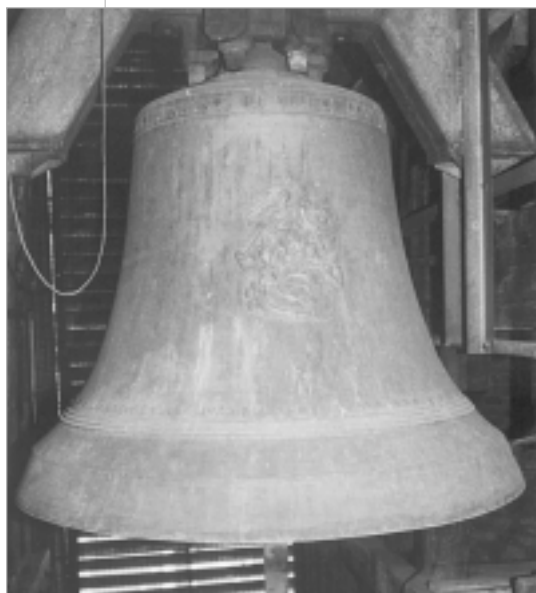
Zvono »Uznesenja BDM« ili »Velika Gospa«, saliveno u Innsbrucku 1985.