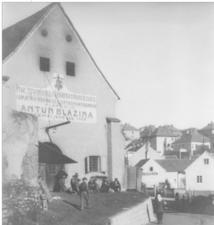
Nekadašnja zvonarnica u Zagrebu u današnjoj Zvonarničkoj ulici. Porušena je 1935. godine. Prema tradiciji na tome se mjestu nalazio samostan tempelara, a zgrada zvonarnice je vjerojatno bila kapela.

Prvo zvono A. Koch salio je za kapelu sv. Petra i Presv. Trojstva u Gorici Petričkoj, župa Samarica 1863 godine. Gornje dijelove zvona ukrašavao je vijencem od lišća. Natpise je stavljao samo ako su bili naručeni.