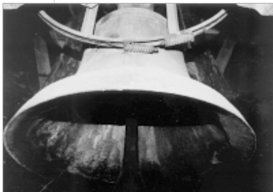
Zvono »Sv. Stjepana kralja« ili »Štefan«, salio ga je Josip Angerer 1777.

3. Iz početka 19. stoljeća potječe i malo zvono »Sv. Florijana« ili »Cinkuš«. Smješteno je u sjevernom zvoniku. Donji promjer iznosi 56 cm, težine 110 kg. Ima simpatičan, ali još neispitan ton. Biskup M. Vrhovac, prigodom vizitacije 1792. godine, navodi zvono sv. Martina kojeg nazivaju cinkuš: » Campanulam S. Martini czinkuss vulgo dictam «. Cinkuš je pozivao kanonike i nadarbenike na konventualnu sv. Misu koja je počinjala u 9 sati te na Večernjicu koja se molila u 15 sati, jedan sat prije, tako da su se stigli na vrijeme spremi, pa