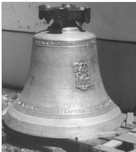
Zvono »Sv. Kvirina«, saliveno u Innsbrucku 1985.

100 cm. Osnovni ton (prima): G 1. 60 Na kruništu je grb Prvostolnog Kaptola, grb bl. Alojzija Stepinca, Hrvatski grb i austrijski orao. Na plaštu zvona je grb zvonoljevačnice i natpis: »MICH GOSS J. GRASSMAYR IN INNSBRUCK 1985.« Zatim je natpis: »NA ČAST SV. KVIRINU, SISAČKOM BISKUPU, PRVOM BISKUPU TERITORIJA SADAŠNJE ZAGREBAČKE NADBISKUPIJE, NA SPOMEN 900. GODIŠNICE OSNUTKA ZAGREBAČKE BISKUPIJE I KAPTOLA DAROVAO MILAN BALENOVIĆ, KANONIK ZAGREBAČKI G. 1985.«