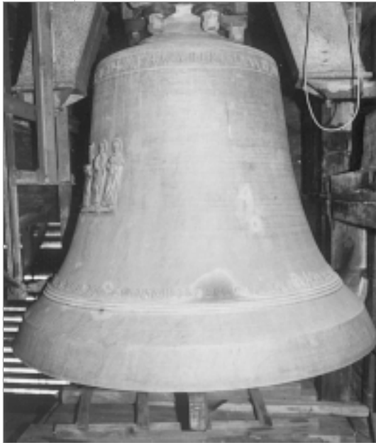
Zvono »Sveta Tri Kralja«, saliveno u Innsbrucku 1985. (Na njemu se nalazi hrvatski grb i grb zagrebačkog nadbiskupa Alojzija Stepinca.