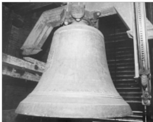
Zvono »Sv. Mihaela«, saliveno u Innsbrucku 1986.

Na kruništu je grb Prvostolnog Kaptola, bl. Alojzija Stepinca, Hrvatski grb i austrijski orao. Uz grb lijevaonice stoji natpis: »MICH GOSS J. GARSSMYR IN INNSBRUCK 1986.« Uz reljefni lik sv. Mihaela Arkandela s plamenim uzdignutim mačem u za-