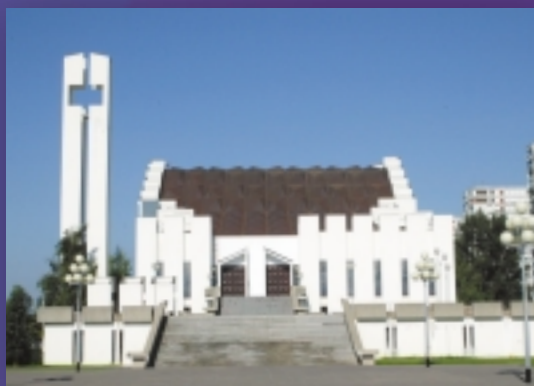
› Sv. Križ, Zagreb-Siget