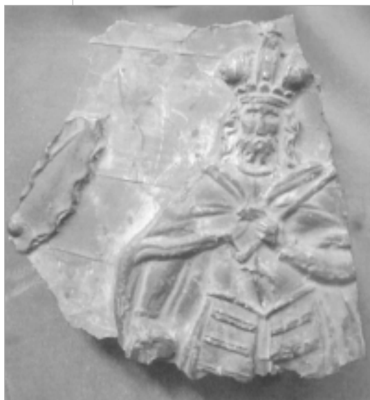
Reljefni lik sv. Ladislava s istoimenog zvona, sačuvan je u riznici zagrebačke katedrale.