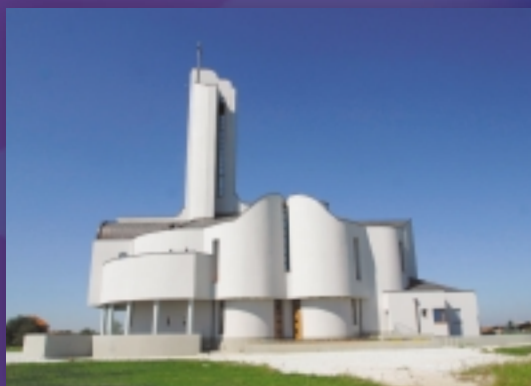
› Sv. Kvirin Sisački, Sisak