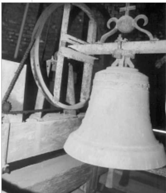
Zvono »Mala Gospa«, salio ga je Viktor Šikić 1950. godine u Zagrebu.

je i danas ostala tradicija da zvonu svakodnevno, redovito u 8 i 14 sati. U starija vremena kanonici su dolazili na sastanke ili molitvu na glas »Većeg zvona«, ad sonum maioris campanae . 53 Za vrijeme potresa 1880. godine Cinkuš je zajedno s tadašnjim zvonima ostao visjeti bez zidova i kupole zvonika. Kako je bio napravljen privremeni drveni tornjić, na vrhu tog tornjića napravljena je bila laterna gdje je bilo smješten i Cinkuš, i 20. kolovoza 1881. godine je ponovno redovito zvonio jutrom u 8 i poslije podne u 2 sata. U novije vrijeme je zatvorenicima u Petrinjskoj ulici služio za vremensku orijentaciju. Prigodom namještanja novih zvona 1986. godine, morao je ponovno malo zašutjeti. Naime, privremeno je bio smješten na najvišem mjestu, u polju jakih električnih naboja, pa je privlačio gromove više od gromobrana.